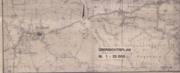
ÜBERSICHTSPLAN M. 1 : 25 000